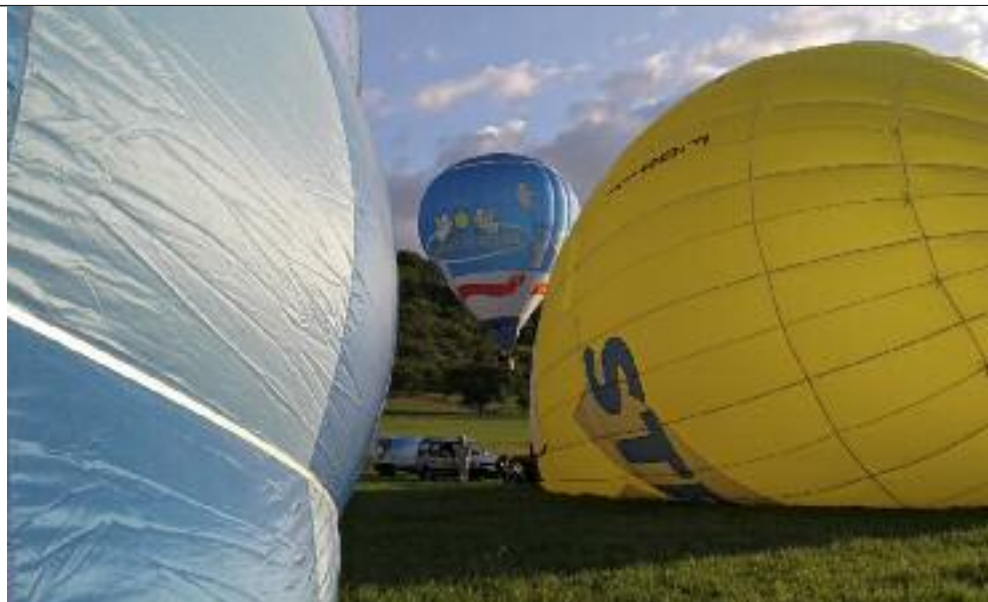
Jede Ballonfahrt ist ein Erlebnis