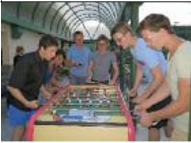
Auch am Boden immer aktiv