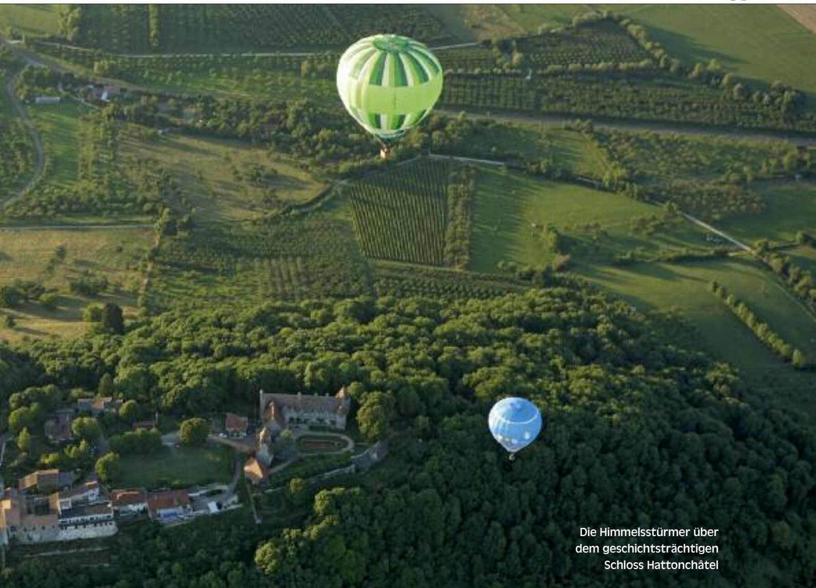
Die Himmelsstürmer über dem geschichtsträchtigen Schloss Hattonchâtel