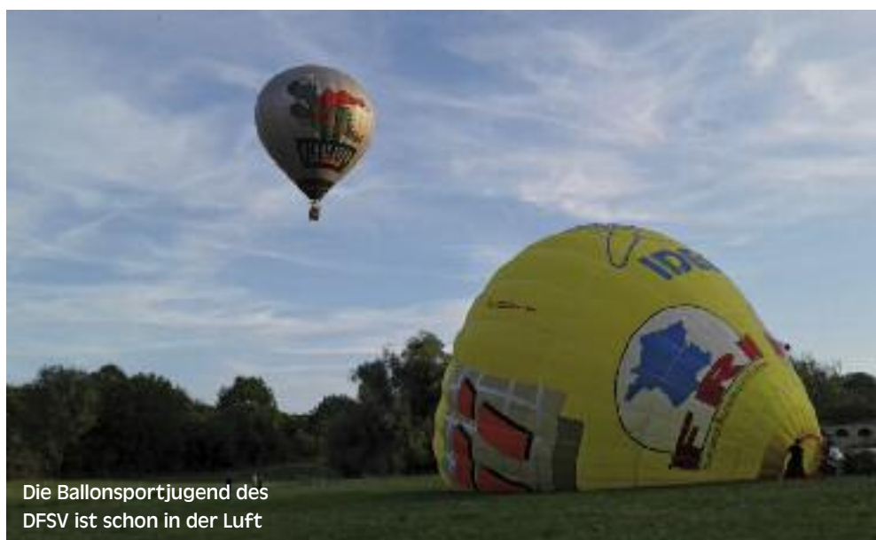
Die Ballonsportjugend des DFSV ist schon in der Luft