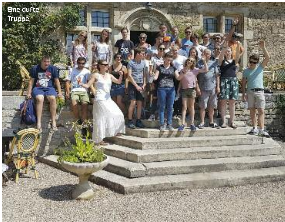
Eine duftige Truppe