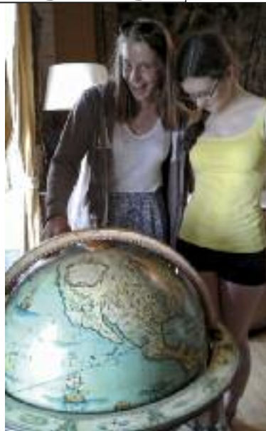
Werden hier am Globus bereits größere Fahrten geplant?