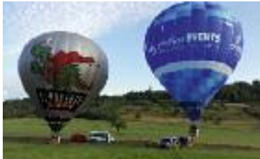
Startbereit – jetzt geht's los, der Erste ist schon in der Luft