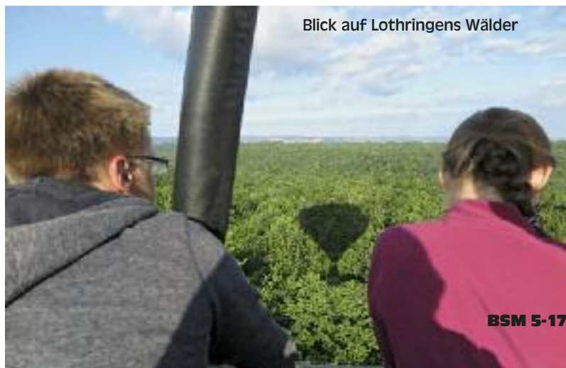
Blick auf Lothringens Wälder