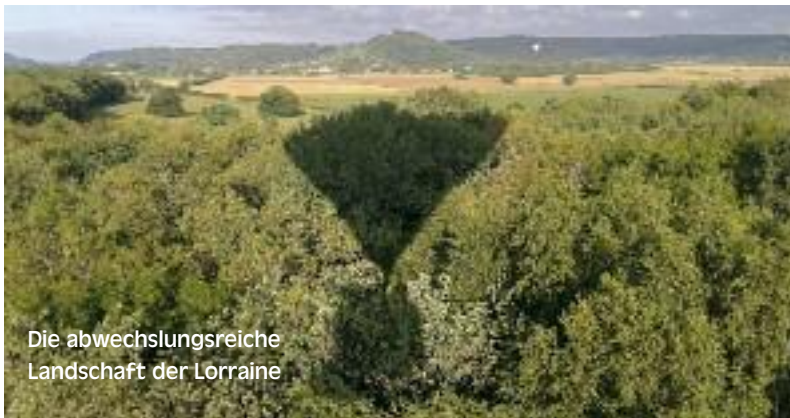
Die abwechslungsreiche Landschaft der Lorraine

in Gruppen unsere Ballone aufzurüsten. Obwohl sich die Ballone alle sehr stark ähneln, bauen alle Piloten sie ein wenig anders auf, weswegen man mit wachem Auge dabei sein sollte. Und schon erheben sich die ersten in die Lüfte, winken hinunter und genießen nach kurzer Zeit auch die Aussicht.